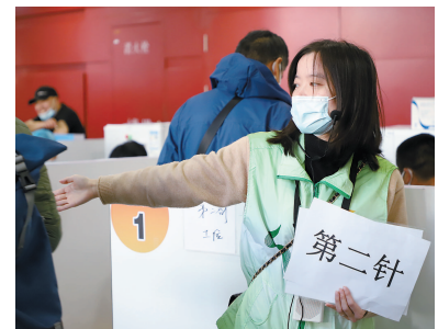
农行上海市分行组织青年党员在疫苗接种现场开展志愿服务。