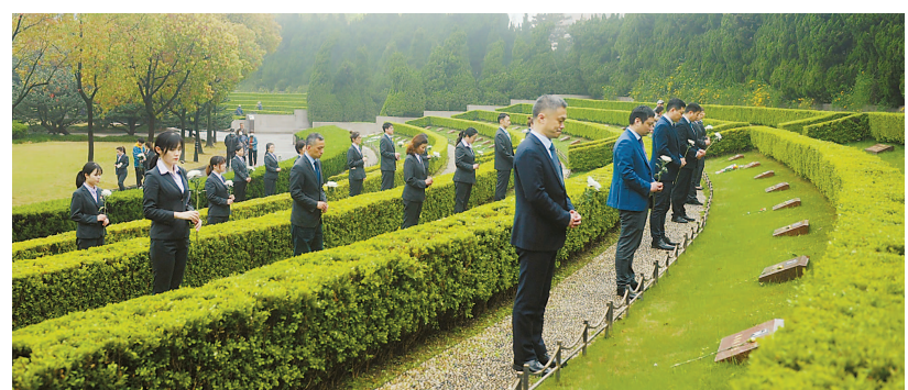
农行上海市分行基层党组织赴龙华烈士陵园开展爱国主义教育。

一是强调原原本本学。为全行3700名党员购置发放指定学习材料,引导党员干部端正学习态度,原原本本学习习近平总书记重要讲话,基层党组织通过“三会一课”、主题党日以及个人自学等形式开展学习。二是机关党委带头学。分行机关党委制定“迎建党百年、守初心使命”主题活动方案,增设“学习强国”积分竞赛活动,排摸本部门条线群众痛点难点问题,共收集群众难题33个,并落实具体解决措施、时间表和责任人。三是基层一线创新学。各经营行利用微信小程序开展丰富多彩的主题党日活动。四是青年员工生动学。分行团委组织青年员工开展原创歌曲、改编歌曲创作以及红色基地插画创作,帮助困难青年员工解决租房难题,开展困难青少年众筹课业辅导活动,超330名青