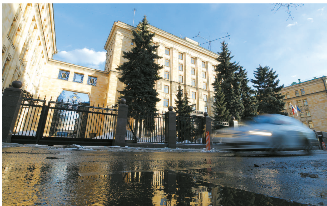
这是2018年3月29日在俄罗斯莫斯科拍摄的捷克驻俄罗斯大使馆。捷克政府17日以俄罗斯情报人员涉嫌参与2014年捷克军火库爆炸事件为由,要求18名俄罗斯驻捷克使馆人员48小时内离境。

华东师范大学国际关系与地区发展研究院院长刘军表示,自2014年克里米亚危机后,俄罗斯与西方之间的外交“驱逐战”并不罕见,