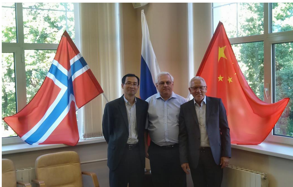
中挪俄“国际治理与商务”硕士项目三方负责人

中挪俄“国际治理与商务”硕士项目是华东师范大学国际关系与地区发展研究院、俄罗斯研究中心与挪威诺德大学、莫斯科国际关系学院三方共同建设的,项目依托中挪俄三方各自学科优势,在国际能源合作领域、大型石油天然气跨国企业、大型跨国公司国际合作领域培养复合型高层次的专门人才。