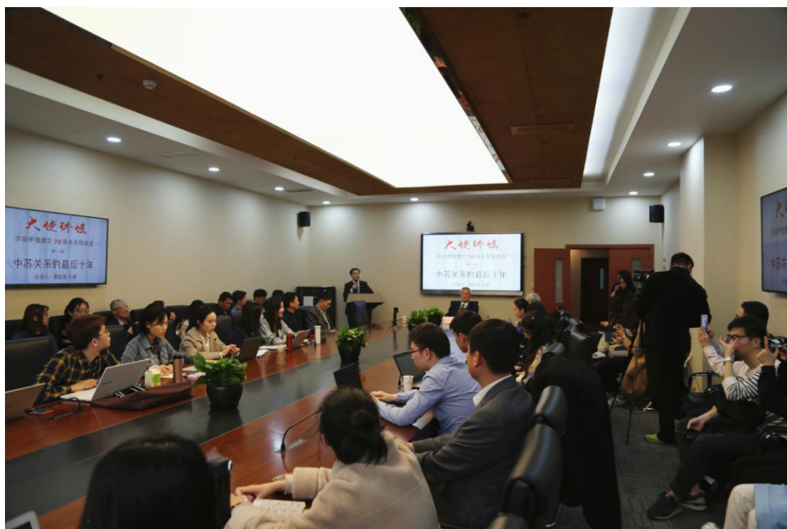
我院举办“大使讲坛”庆祝中俄建交 70 周年系列讲座第一讲

交 70 周年系列讲座”《中苏关系的最后十年》主题演讲。讲座由国际关系与地区发展研究院党总支部书记、俄罗斯研究中心副主任贝文力主持。来自我校各院系和兄弟院校的师生代表共同聆听了演讲。