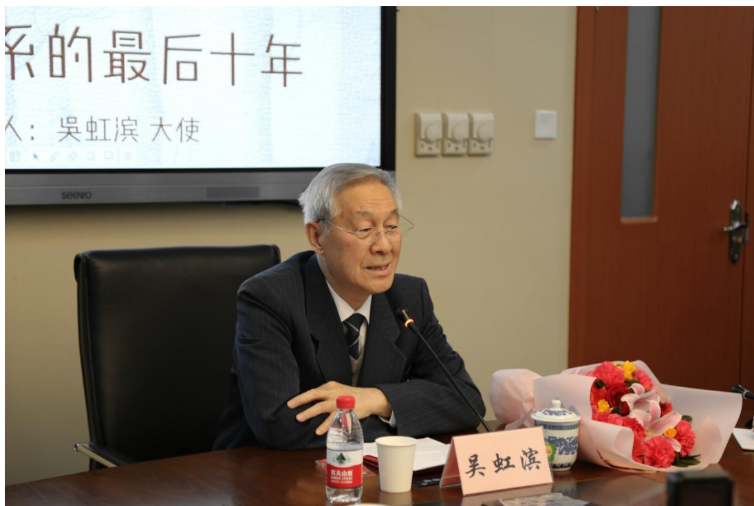
吴虹滨大使做《中苏关系的最后十年》主题演讲

2019年是中俄建交70周年。华东师范大学俄罗斯研究中心从3月起举办“大使讲坛”——庆祝中俄建交70周年系列讲座，邀请多位大使围绕中俄关系做主题演讲。