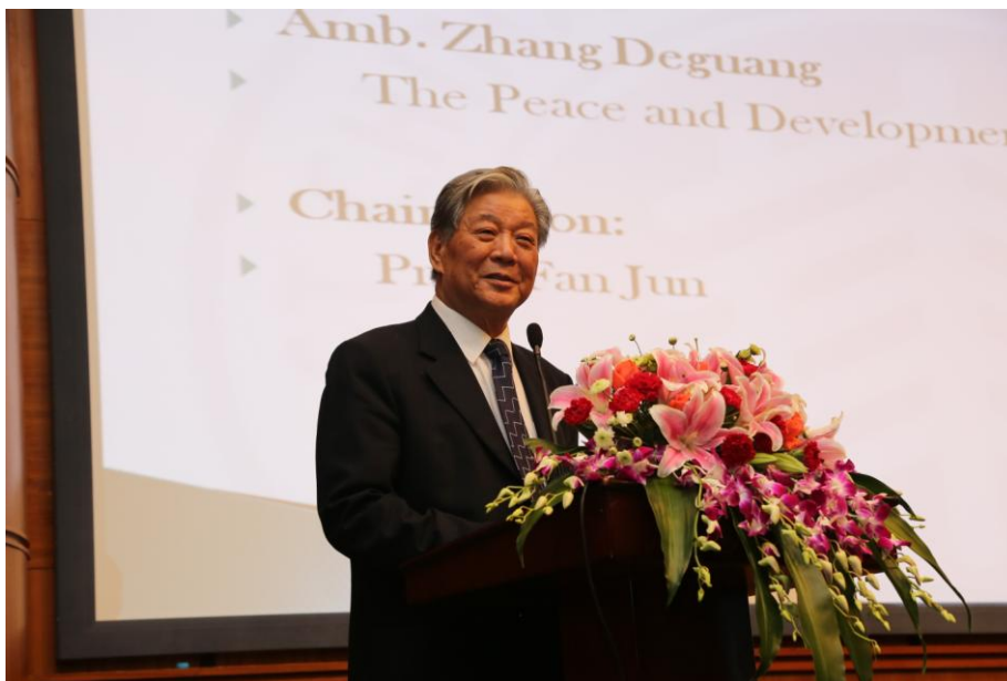
上海合作组织首任秘书长、中国驻俄罗斯前大使张德广应邀为大会做主旨演讲

上海合作组织首任秘书长、中国驻俄罗斯前大使张德广应邀为大会作了题为“大欧亚的和平与发展问题”的主旨演讲。张德广大使在演讲中指出，目前大欧亚既面临着机遇，也面临着挑战。全球化的发展一定程度上提高了发展中国家的地位，亚欧大陆在政治经济安全上的共同利益、诉求有了新的着力点，这是欧亚面临着的与时俱进的机遇。