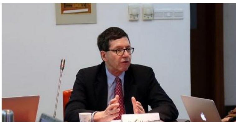
哈里·哈丁教授作主旨演讲

2016年3月2日，亚洲事务专家、弗吉尼亚大学政治学教授哈里·哈丁到访华东师范大学国际关系与地区发展研究院、俄罗斯研究中心，并为学院师生带来了题为“美国对华政策失败了吗？”的演讲。白永辉教授主持本次讲座。