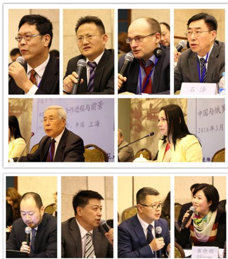
参与第一阶段发言和讨论的代表们

提出解决办法，为两国的决策部门提供智力支持。关于中俄关系的未来，有中国学者认为，中俄关系应包容性发展，即立足于共同点和共同利益，同时包容差异和不同点；中俄应在经济合作方面下定战略性决心，真正把对方作为长期、全面、战略性的伙伴来定位和经营。