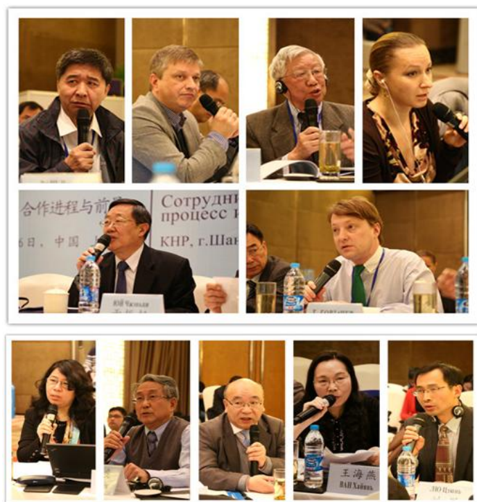
参与第四阶段发言与讨论的代表们