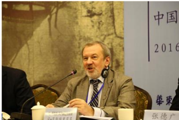
贝斯特里茨基先生在大会中致辞

两国专家学者的相互理解和信任。他还重点介绍了中俄两国在高层交流、经济合作、文化交流、