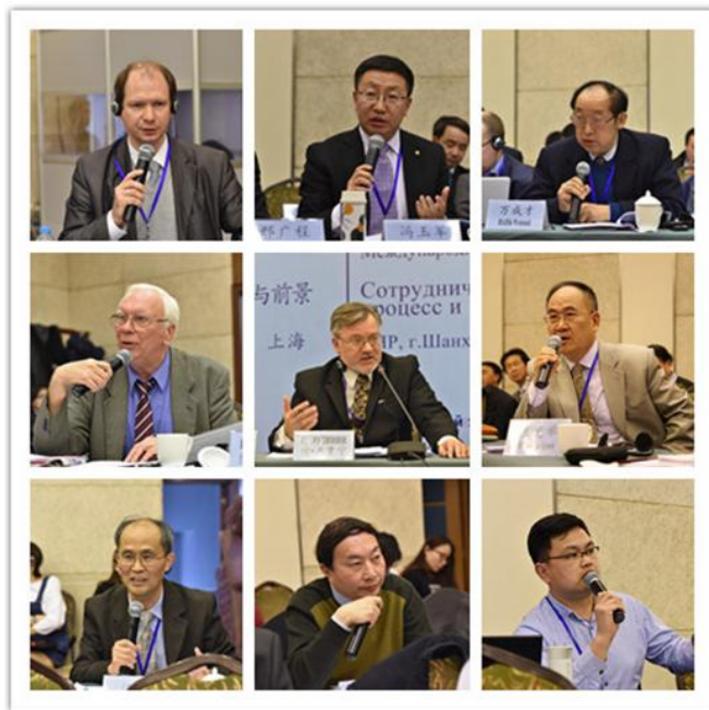
参与第三阶段发言与讨论的代表们

关于中俄在地区层面的合作，有中国学者指出，中俄都是大国，它们都能独立性地发挥重大作用，但它们的合作可产生“1+1>2”的效应，这足以对国际和地区问题产生实质性的影响。有俄罗斯学者指出，俄罗斯、伊朗、中国、印度四国之间可以形成一套合作机制，这将有效保证欧亚大陆的国际合作与经济发展，也将成为世界发展的重要支柱。