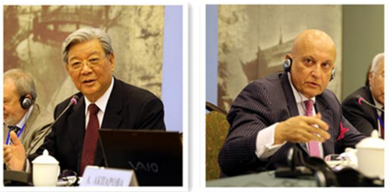
张德广大使与卡拉加诺夫主席做主旨发言

张德广大使表示，中俄关系从 1992 年的“建设性伙伴关系”、1996 年的“战略协作伙伴关系”，到今天的“全面战略协作伙伴关系”，两国关系一直朝着“睦邻友好，互不为敌”的方向发展。中俄政府间互动积极，往来频繁，但两国民众之间缺乏密切的联系和沟通，民间贸易更是中俄关系的短板。中俄两国学者、媒体人应该承担起正确引导新闻动态的责任，拉近中俄人民的联系。“一带一路”和欧亚经济联盟之间的对接将覆盖欧亚大陆，中俄双方应该协调合作，加强“中亚是中俄共同战略利益区”的战略共识。卡拉加诺夫教授在发言中提出了几大重要的全球发展趋势。21 世纪国际社会发展的一个明显趋势是西方实力下降和全球实力分配变化。从冷战的“三极”格局，到当今的多极态势，以美国为首的“超国家经济集团”实力衰落。中俄探讨建立“欧亚联盟”将形成“新两极格局”。今后十年，中国经济将保持平稳增长，中国的崛起将逐渐形成以中国为核心的“欧亚格局”。面对国际秩序新常态，中俄如何开展合作、承担各自任务成为当务之急。中俄应该以上合组织为核心，依托“一带一路”和欧亚经济联盟对接合作，制定“大欧亚计划”。而今的重中之重是确立今后十年或十五年的中俄共同发展目标。