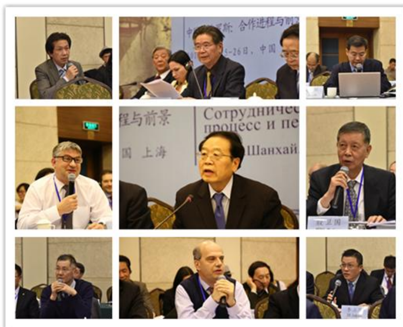
参与第二阶段发言和讨论的代表们