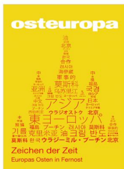
Aus Osteuropa 5-6/2015

2015 年 10 月，由中心主任冯绍雷教授领衔的科研团队在德国东欧研究协会主办的知名 SSCI 期刊《Osteuropa》（《东欧》）发表三篇学术论文。三位中心成员分别就中国的欧洲、苏联、俄罗斯、中亚、东欧研究、国际政治经济等相关问题发出了中国学者的声音，进一步提升我中心在国际上的声誉和影响力。这三篇学术论文是：