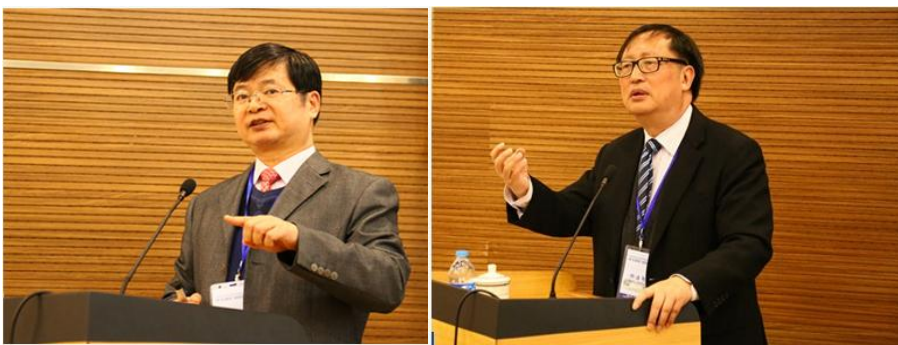
前中国驻孟买总领事刘友法作主旨发言

开幕式后，上海国际问题研究院前院长杨洁勉教授作了“让‘海上丝绸之路’成为推动中国和南亚合作互动的力量”主旨发言。他指出，中国正处在新一轮国内发展的关键时期。从国际上看，机遇与挑战并存，但是挑战大于机遇。中国与南亚还要从结构重组及创新的角度来提升经济合作，努力避免信任赤字及零和博弈。“海上丝绸之路”为中国与南亚的经济合作提供了坚实的基础，为双方政治与安全合作也提供了便利，中国与南亚要利用“海上丝绸之路”倡议作为双方实现互利共赢的重要平台。他认为，中国应该更进一步推进国内的改革开放，应该把中国的发展放在更广阔的世界和平发展与共赢的大背景下来考察。