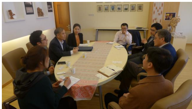
韩国副总领事李康国一行来访会谈