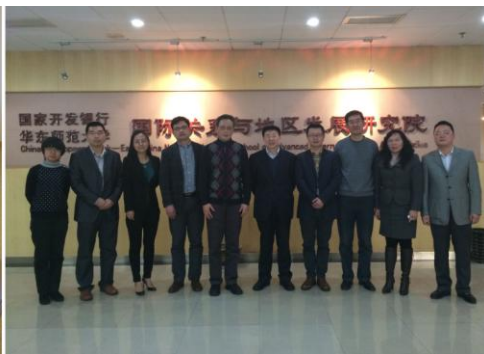
与国家发改委能源所专家合影